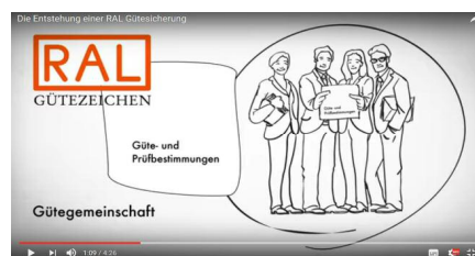
Ein Film erklärt die RAL Gütesicherung

RAL beschäftigt sich mit Industrie- und Konsumprodukten, aber auch mit Verkehrssi-